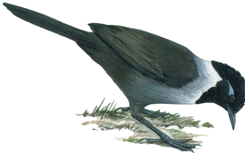
Khướu đầu đen Garrulax milleti